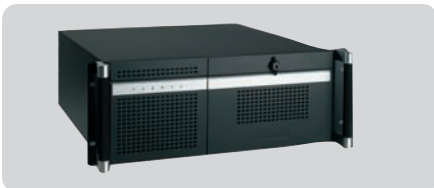
Chasis de 1U a 7U y chasis compactos modulares