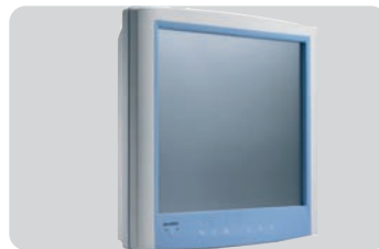
Gama médica 12" a 19"