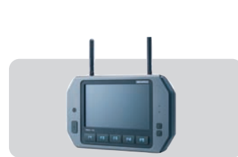
Sistemas específicos para vehiculos 7" a 12"