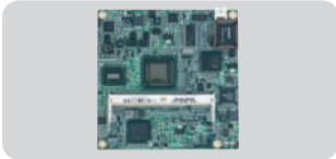
SOM 6760 : SOM EXPRESS MICRO, Intel ATOM®

Placas procesadoras: PC-104, 3.5", EPIC, 5.25", mini-ITX, Micro-ATX y Full-ATX