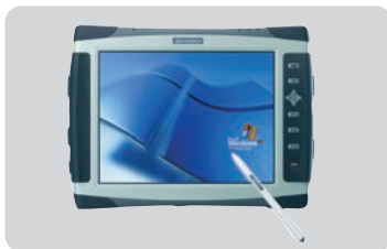
Tablet - PC MARS 3100