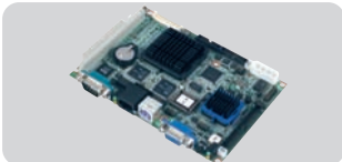
PCM-9375 : 3,5", AMD LX800, VGA, LVDS, LCD