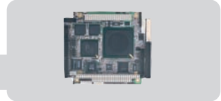
PCM-3353 : PC/104 - Plus, AMD® LX800