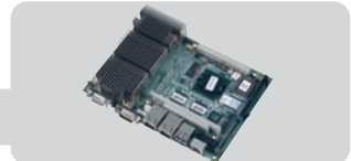
PCM-4386 : EPIC, Celeron® multiples entradas/salidas