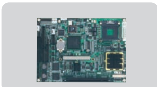
PCM-9590 : 5.25" Core™ 2 Duo