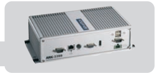
ARK-3399 : Core 2 Duo, multiples entradas/salidas