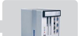
ARK-5280 : Alta modularidad, 2 slots de extensión PCI libres