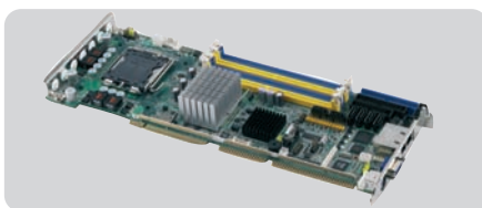
PCA-6194 : LGA775 Core™ 2 Duo/Pentium® 4/ Celeron® D