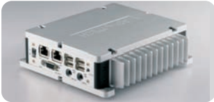
ARK-4000 : Entornos extremos -40° C / +75° C